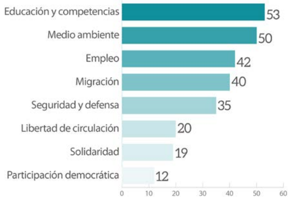
Figura 1: ¿Cuál de los siguientes temas considera que debería ser una prioridad para la Unión? (%)

Fuente de los datos: Eurobarómetro Flash n.º 455 , 2018.